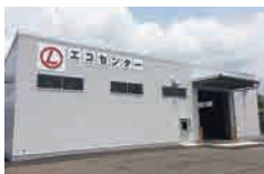
エコセンター外観

組合員や事業所から出る紙やプラ類を集約し、品質の高いリサイクルの一次加工を行う施設を2015年6月に設立しました。県民せいきょうグループ「一般社団法人ほのほのハーツ」で障がい者雇用を行い、就労支援の場づくりとしても位置づけています。